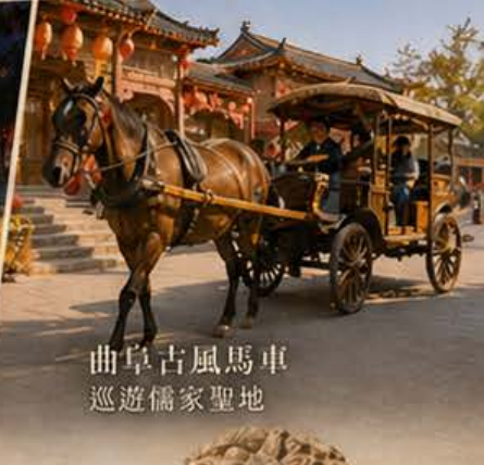
曲阜古風馬車 巡遊儒家聖地