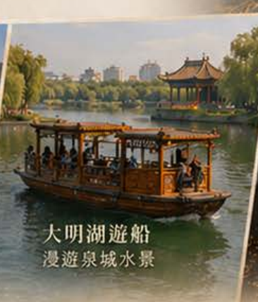
大明湖遊船 漫遊泉城水景