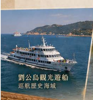
劉公島觀光遊船 巡航歷史海域