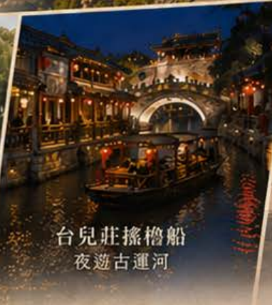
台兒莊搖櫓船 夜遊古運河