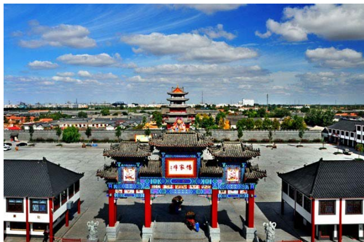
楊家埠民俗博物館