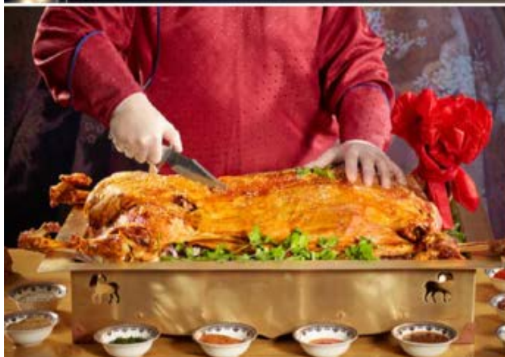
品嚐武隆燒全羊 恩施土家風味料理