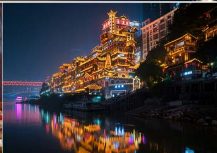
概念98文化客廳 享受洪崖洞江景用餐體驗