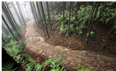
山之參拜道 | 中邊路

【川之參拜道 | 熊野川】：全世界唯二被登錄為世界遺產的河川。我們不只在岸邊觀看，更特別安排搭乘「復古川舟」，重現千年前平安時代皇室貴族的朝聖路徑，隨波逐流間，感受「川之流動」帶來的歲月靜好。