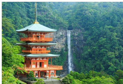
熊野三山 | 那智瀑布

【天空聖域】高野山：登上海拔 800 公尺的密教聖地，在壇上伽藍與奧之院的肅穆氛圍。