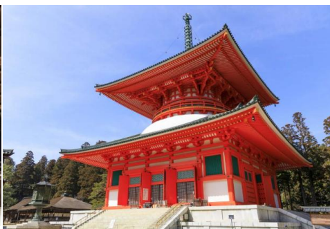
天空聖域 | 高野山