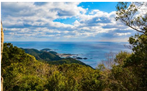
海之參拜道 | 大邊路