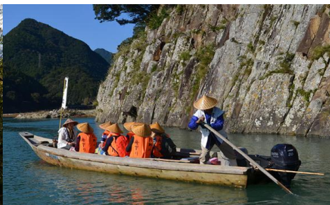
川之參拜道 | 熊野川

2. 本雙聖地與天空之城的極致巡禮 ：不僅僅走完熊野三山，更將行程延伸串起日本信仰的三大頂點。