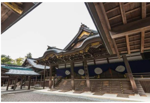
心靈故鄉 | 伊勢神宮