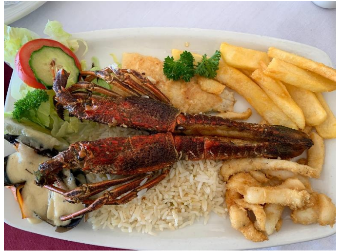
豪特灣 龍蝦海鮮餐