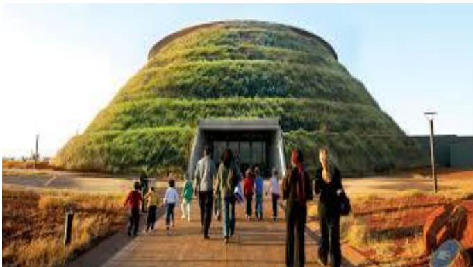
斯特克方丹地區化石遺址