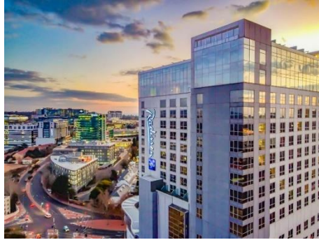
約翰尼斯堡 5 星 Radisson 兩晚