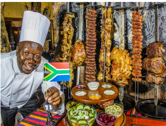
普利托利亞 百獸宴 BBQ