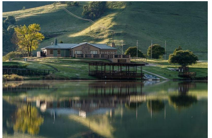
入住德拉肯斯堡公園內 Goodseson Reort