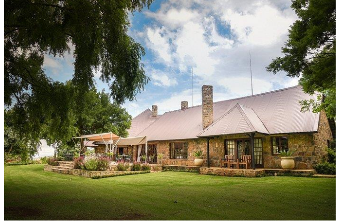
盧瑟納卡爾 五星 Walkerson Hotel & Spa