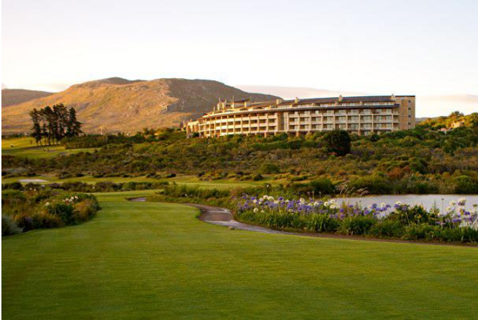
赫曼紐斯 五星 Arabella Hotel Golf & Spa