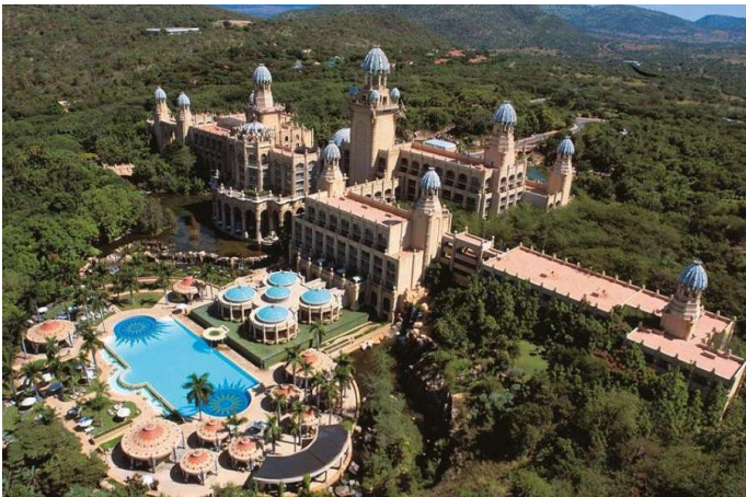
太陽城 五星 The Palace Of Lost City