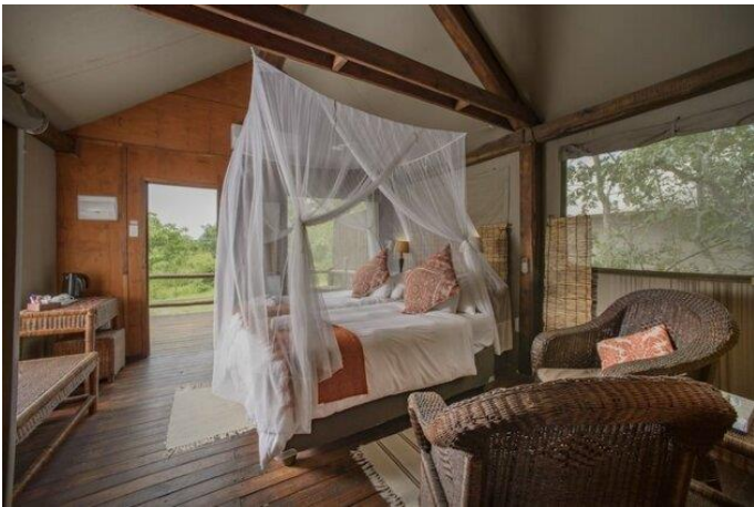
入住克魯格國家公園內 Nkambeni Camp 兩晚