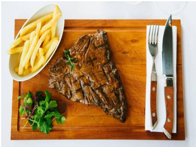
約翰尼斯堡 Butcher Shop 排餐