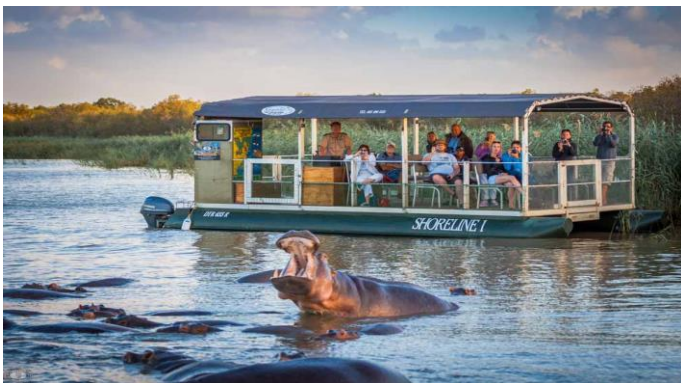
伊西曼格利索濕地公園