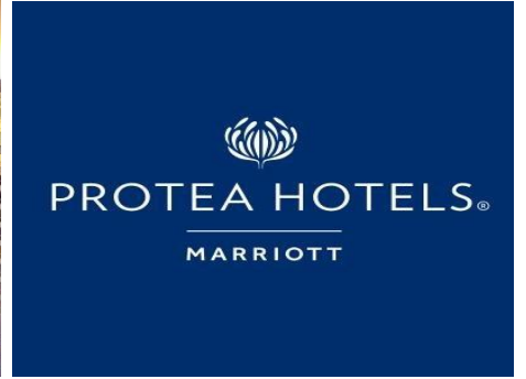
Protea By Marriott 系列飯店