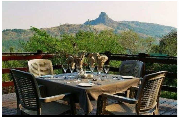
史瓦帝尼王國山谷內 Mantenga Lodge