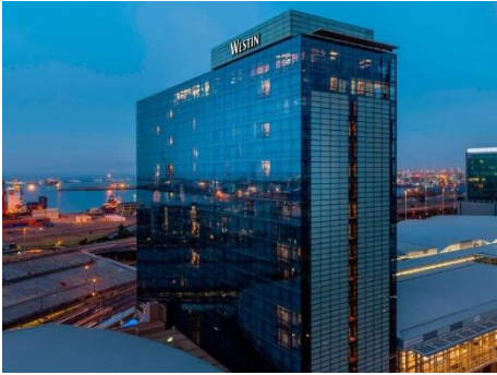
開普敦 5 星 WESTIN 兩晚