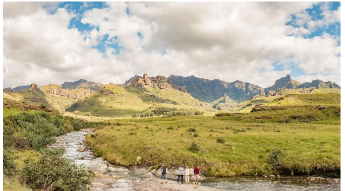
馬羅提-德拉肯斯堡公園